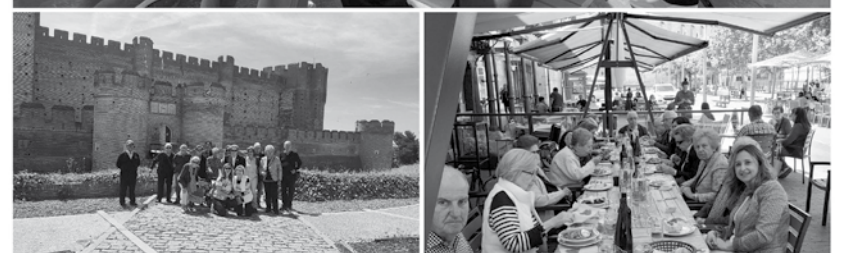
Un grupo de residentes disfrutando de la salida.