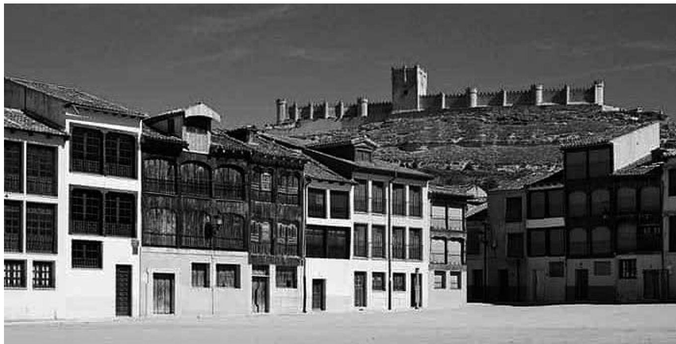
Bonita imagen del pueblo de Peñafiel.