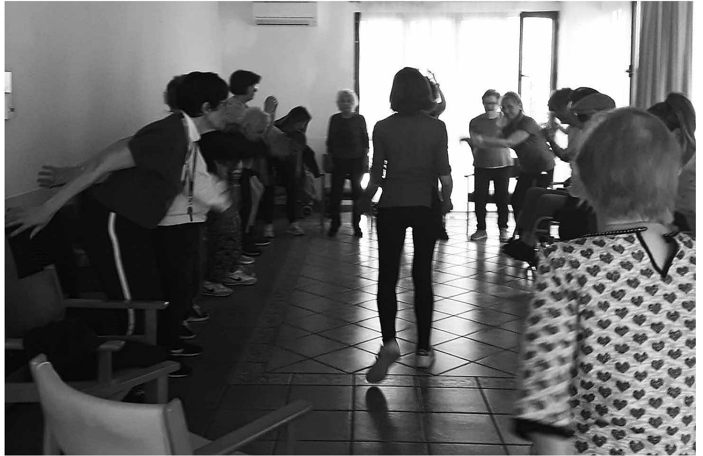
Un momento captado en una de las sesiones.