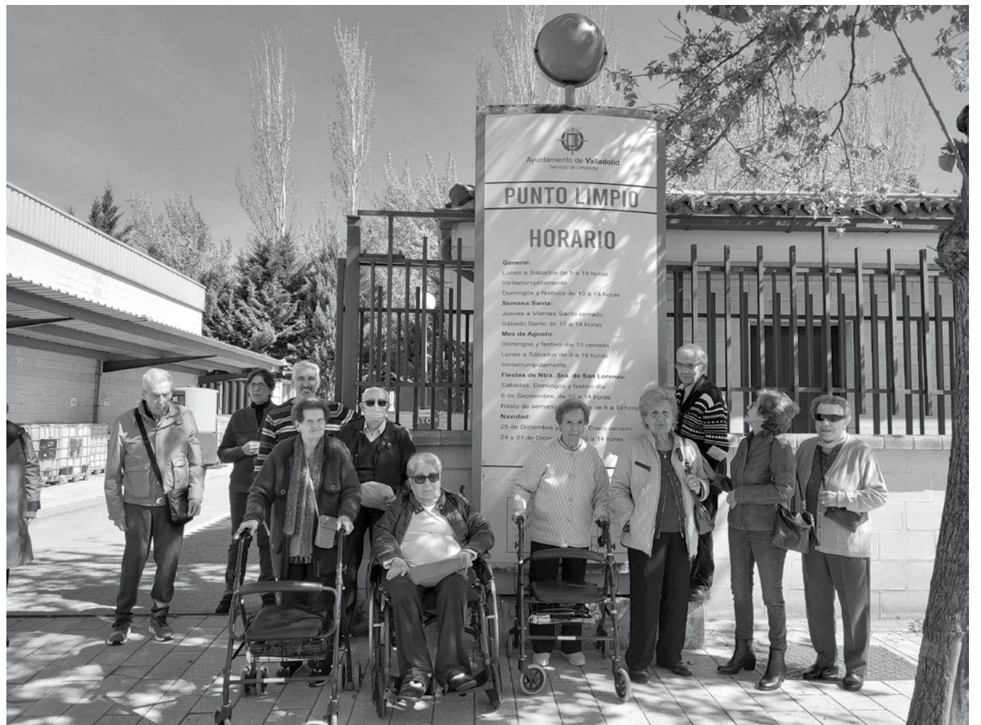
Visitando el punto limpio.

Con el fin de dar un paso más hacia la concienciación sobre el cuidado medioambiental y la sostenibilidad, estamos realizando una serie de acciones con los residentes de Amavir El Encinar del Rey. En el Día Mundial del Agua nos acercamos hasta las Arcas Reales para, mediante una amena visita teatralizada a cargo de Acuavall, conocer cómo se canalizó el agua en la ciudad de Valladolid desde el siglo XV. De la mano de Urbaser y el Ayuntamiento de Valladolid, hemos podido conocer desde dentro cómo funciona un punto limpio, los distintos tipos de residuos que llegan allí y cómo se gestionan una vez allí. Además, gracias al aula medioambiental de la Caja de Burgos, hemos podido participar en una actividad de lo más interesante.