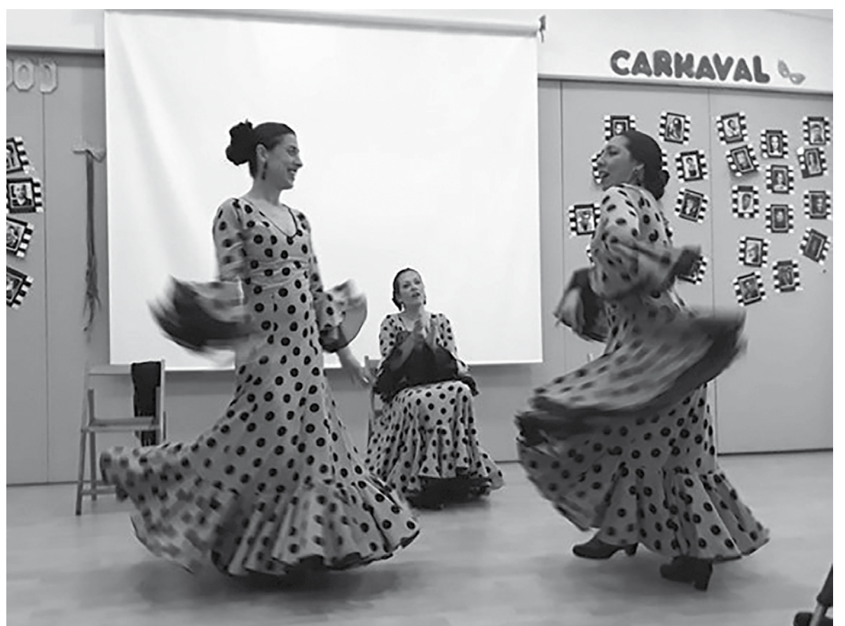
Vam gaudir amb l'espectacle de les sevillanes i el seu espectacle!

A finals d'abril vam tenir una actuació de sevillanes a la residència. La primera part va consistir a escoltar i veure les sevillanes, i en la segona part els nostres residents van poder ballar-ne algunes. Vam gaudir de les cançons, dels balls i dels vestits adequats per a l'ocasió. Les sevillanes van ser molt variades, cosa que va fer que el públic es divertís amb balls de moviments diferents. Finalment, els nostres residents van oferir uns obsequis d'agraïment als membres del grup de sevillanes.