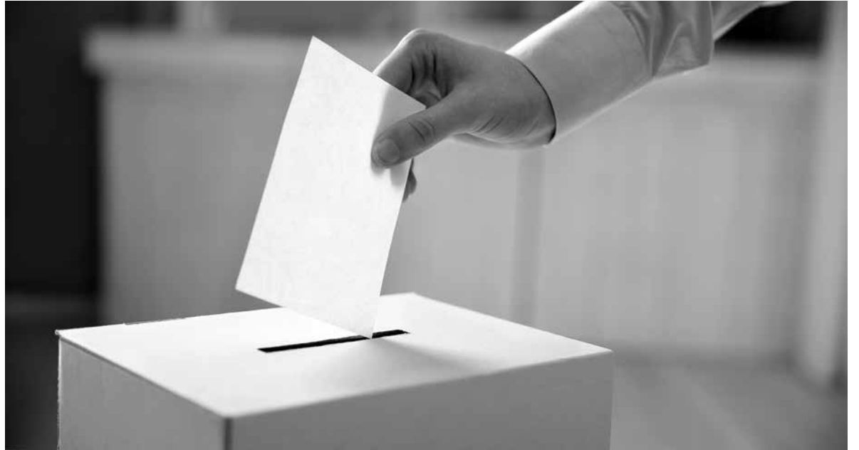
Urna de votació.

Aquest passat mes de abril es va constituir el Consell de participació del centre. És un dels mètodes pel qual el departament de Benestar Social i Família intenta integrar en el procés de participació, disseny i implementació del centre usuaris, familiars, treballadors, responsables de la Direcció i de l'Administració pública, amb l'objectiu de quantificar i valorar la qualitat dels serveis. Les funcions del Consell de participació són les següents: informar anualment sobre la programació general de les activitats del servei; rebre informació de la marxa general del servei; elaborar i aprovar el projecte de reglament de règim interior del servei i les seves modificacions; informar sobre la memòria anual, que ha de contenir l'avaluació de resultats terapèutics, socials i econòmics, de caràcter públic, del servei; fer propostes de millora del servei, i fer públics