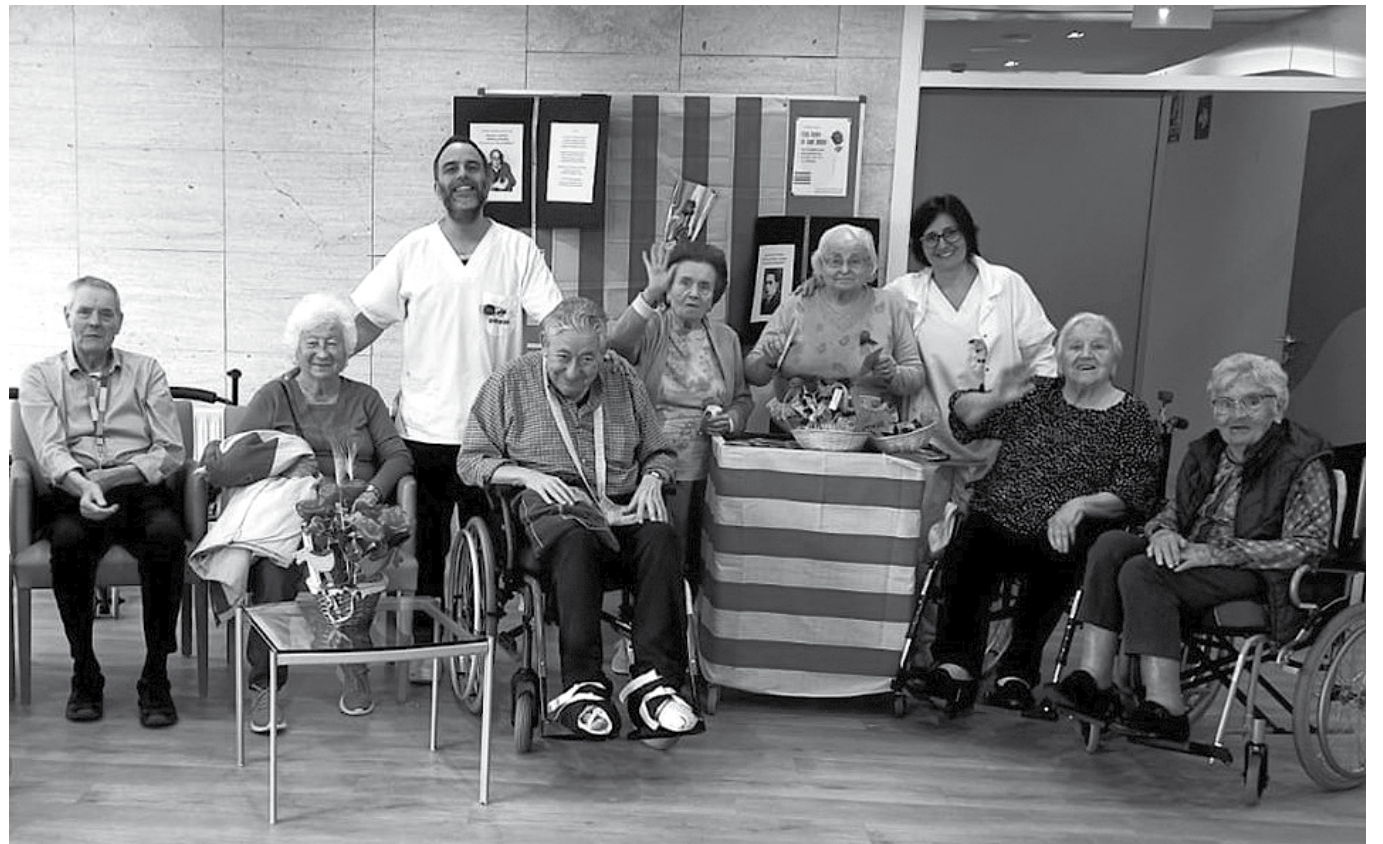
Venda de roses i punts de llibre a la nostra residència.

El dia 23 d'abril vam celebrar la diada de Sant Jordi. De matí vam fer una obra de teatre sobre la llegenda de Sant Jordi amb uns mosaics reversibles (en una banda es podia llegir "Sant Jordi 23 Abril 2024" i en l'altra es podien veure els dibuixos sobre la llegenda de Sant Jordi). Després de l'obra es van fer preguntes de memòria sobre la llegenda representada al públic. El públic va encertar les respostes a totes les preguntes, ja que va estar molt atent. Finalment es va llegir un text feminista sobre la princesa Violant i es va representar un conte amb missatge sobre una rosa i un gripau. Després de gaudir d'un menú especial amb un pastís decorat amb