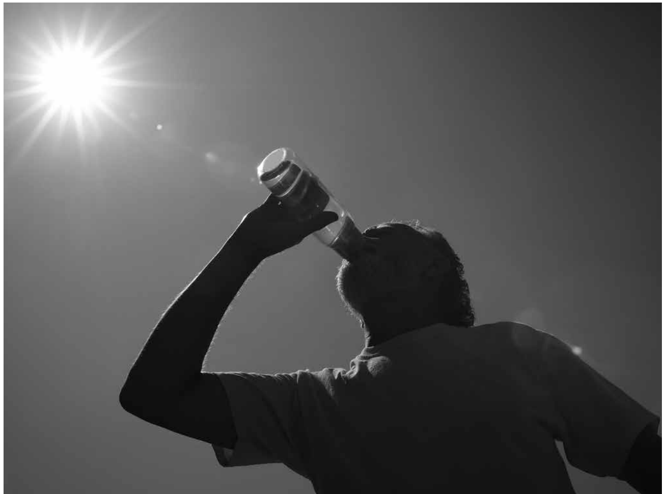
Persona mayor hidratándose.

Las personas mayores son muy vulnerables a sufrir una deshidratación debido a los cambios fisiológicos y las limitaciones físico-cognitivas. El manejo debe evaluarse preferiblemente a través de la terapia de rehidratación oral y la parenteral (sueroterapia) en casos excepcionales. La deshidratación está influenciada por diferentes factores como son la baja ingesta hídrica fisiológica y la patológica como las pérdidas digesto-urinarias. El personal sanitario debe mantener una hidratación oral adecuada de los mayores teniendo en cuenta los cambios fisiológicos del envejecimiento, los cuales disminuyen la sensación de sed y la capacidad del organismo de mantener un balance hídrico. Por tanto, es muy importante conocer las consecuencias de la deshidratación. Los factores como el verano y el uso de diuréticos empeoran la situación basal de los mayores. Debemos concienciar a residentes y familiares sobre la importancia de una hidratación adecuada.