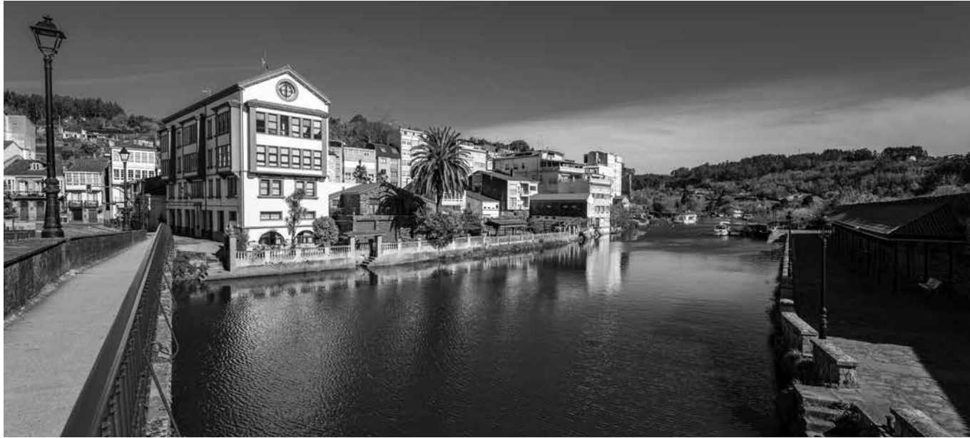
Vista panorámica de Betanzos.