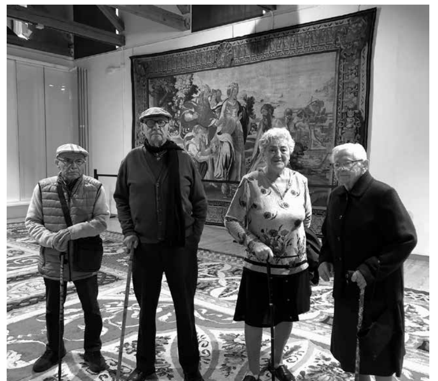
Nuestros residentes durante la visita.

Con el objetivo de fomentar salidas del centro de tipo cultural o lúdico, seguimos realizando diversas excursiones. El pasado 3 de abril visitamos la Real Fábrica de Tapices con un grupo de nuestros mayores. Nos encantaron las explicaciones al respecto y pudimos comprobar in situ como se hacen totalmente a mano los tapices, algunos de los cuales adornan los edificios más emblemáticos de nuestro país. Allí vimos incluso nuevas creaciones que tienen en marcha, así como reparaciones de grandes alfombras. Nuestros residentes disfrutaron de un día espléndido aprendiendo sobre esta actividad centenaria, que gracias a la existencia de este taller, permite seguir desarrollando una labor como esta.