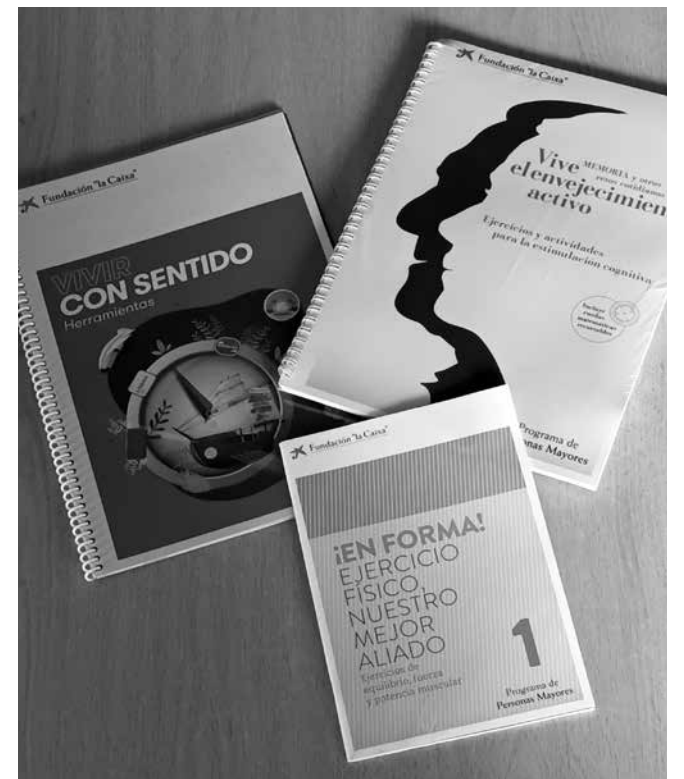
Uno de tantos programas de La Caixa.

desarrollada durante todo el año por nuestro gran equipo de profesionales. Para nosotros ha sido todo un descubrimiento poder acogernos a este programa y ver que en líneas generales ha sido recibido con una gran participación. Las sesiones se disponen en grupo de forma semanal siendo por lo general de hora y media con grupos de 10 a 15 participantes de media. Algunas de las sesiones se realizan con proyector y pantalla siendo actividades interactivas y muy participativas. Esperamos poder seguir siendo partícipes en este y otros programas tanto de iniciativa privada como pública con el objetivo de prestar la mayor atención a nuestros residentes y usuarios de centro de día.