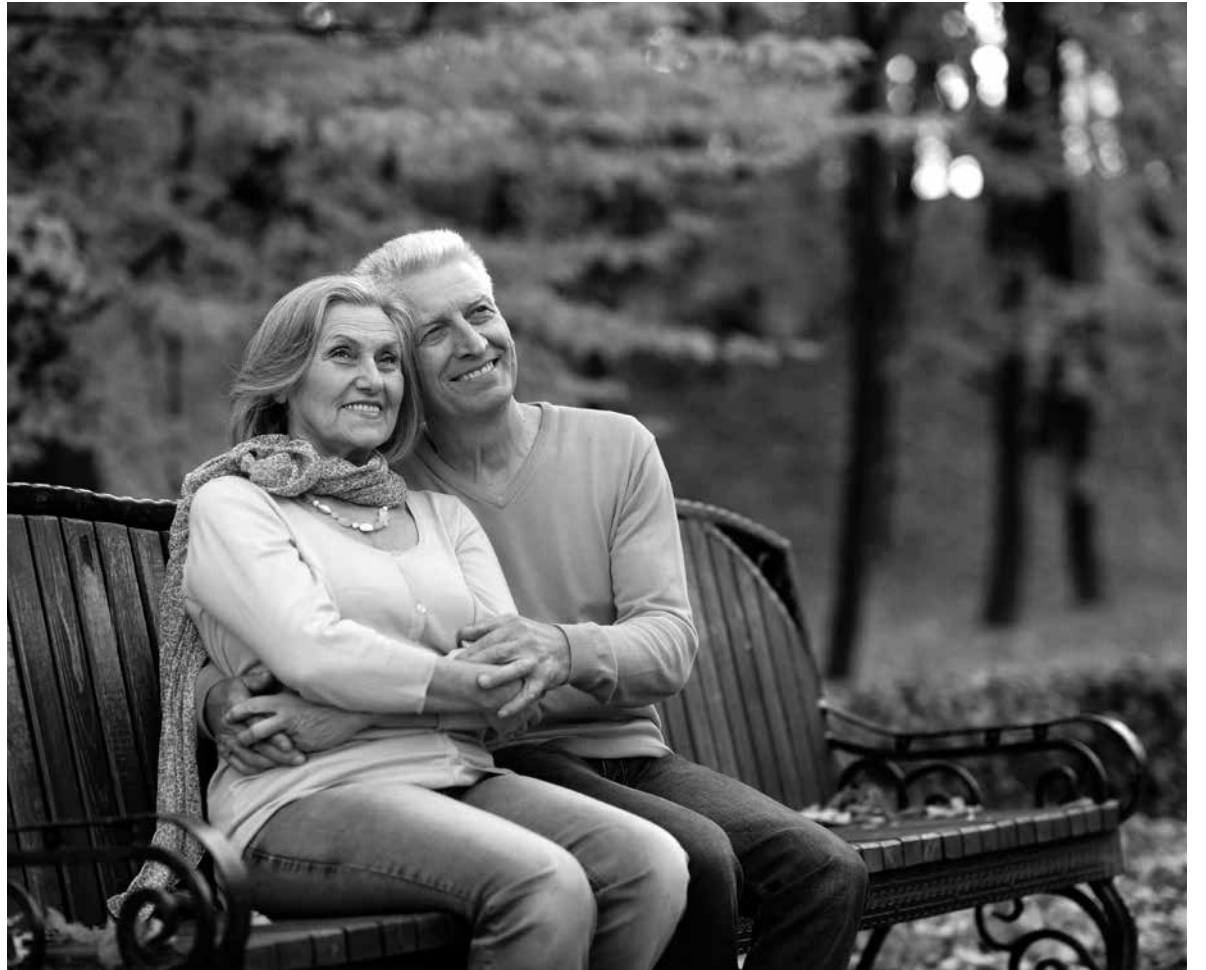
El otoño es una segunda primavera donde cada hoja es una flor.

Con el suave susurro del viento y el crujir de las hojas, el verano se despide para dar paso a una de las estaciones más encantadoras de año, el otoño. Una de las maravillas del otoño es su paleta de colores. Los árboles se visten de tonos cálidos que transforman el paisaje en un cuadro pintado por la naturaleza. Las hojas caídas crean una alfombra crujiente que invita a ser explorada, y cada paso resuena con la melodía del cambio. Con el final del verano, muchos de nosotros regresamos a la rutina. Las vacaciones terminan y es momento de retomar actividades, ya sea en el trabajo, la escuela o en proyectos personales. El otoño también nos trae nuevos sabores. Es la época de las calabazas, las manzanas, las castañas etc. Las recetas de sopas y guisos se convierten en protagonistas de nuestras cocinas. La llegada del otoño y el descenso de las temperaturas puede provocar una bajada de defensas en muchas personas, sobre todo en nuestros mayores. Es importante prestar atención a su bienestar físico y emocional y brindarles toda nuestra atención y cariño para que puedan seguir disfrutando de esta maravillosa estación.