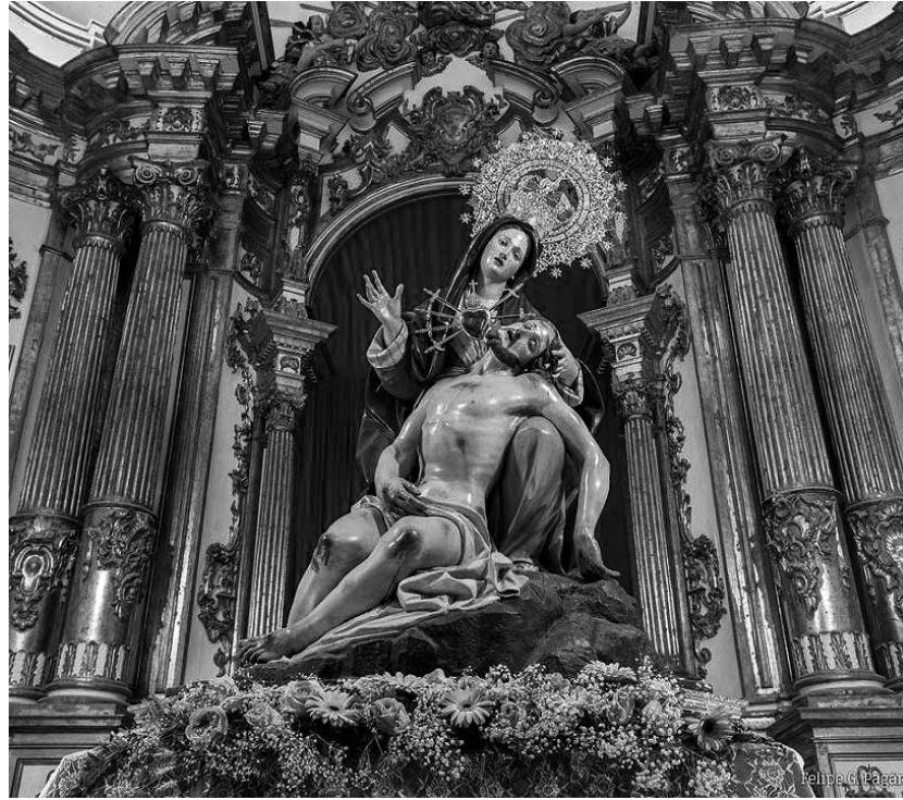
La patrona de Cartagena.