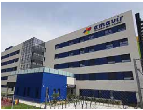
Ctra. de Vicálvaro a Estación de O'Donnell 29, 28032 - Vicálvaro (Madrid)

Además de ampliar la oferta de plazas para atender a las personas mayores y dependientes de estos municipios, la apertura de estos centros servirá también para generar más de 300 puestos de trabajo.