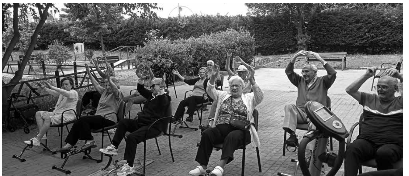
Pedaleando en el jardín.

Desarrollamos una actividad con los residentes a través de la cual mezclamos la música, la diversión y el ejercicio físico. Fue una clase de spinning adaptada a las necesidades de los mayores, en la que disfrutaron y trabajaron al ritmo de la música. Hicimos varios ejercicios de coordinación combinando el pedaleo y la movilidad de los brazos al ritmo de la música. Tuvo una duración de unos 40 minutos en la que nuestros usuarios disfrutaron mucho. Nos confesaron que