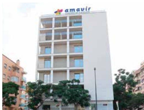
Calle Carles Riba 12-14-16, 43204 - Reus