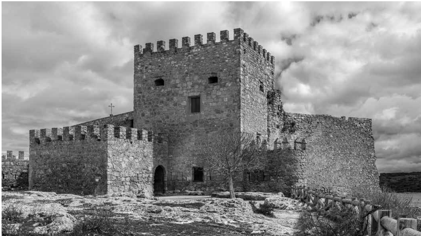
El castillo del pueblo.