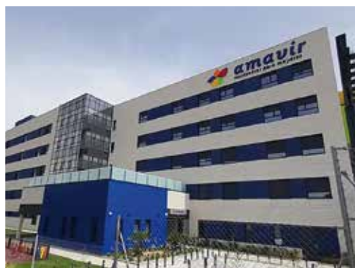
Ctra. de Vicálvaro a Estación de O'Donnell 29, 28032 - Vicálvaro (Madrid)

Además de ampliar la oferta de plazas para atender a las personas mayores y dependientes de estos municipios, la apertura de estos centros servirá también para generar más de 300 puestos de trabajo.