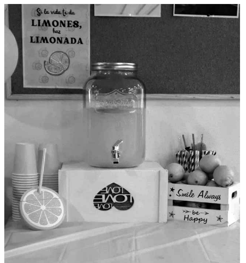
Nuestro rincón de limonada durante el bingo.

En Amavir Getafe recordamos cómo recibimos el verano por todo lo alto en el mes de junio. Con el comienzo del verano en Amavir Getafe, decidimos hacer un bingo especial para residentes y familias. Preparados en la zona más amplia del centro, al lado de la cafetería, muchos usuarios y sus familias pudieron disfrutar juntos de un juego que tanto entretiene y divierte. Y, por supuesto, los ganadores tuvieron sus merecidos premios. El bingo constituye una de las primeras formas de juego popular. Y, aunque antiguamente se utilizaba para el recaudo de dinero y riquezas, a día de hoy es un juego muy utilizado para brindar diversión y entretenimiento a los que participan. Después del bingo, todos pudimos disfrutar de una fresquita limonada para poder sobrellevar el calor de aquella temporada.