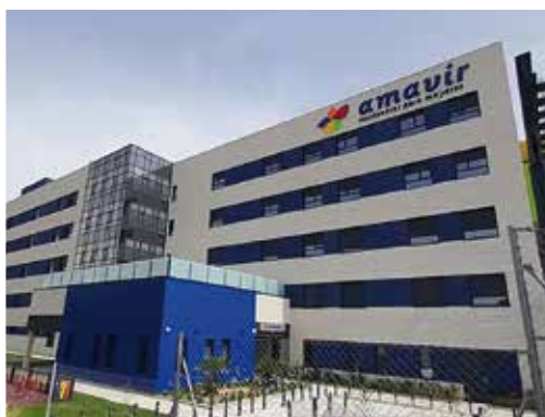
Ctra. de Vicálvaro a Estación de O'Donnell 29, 28032 - Vicálvaro (Madrid)

Además de ampliar la oferta de plazas para atender a las personas mayores y dependientes de estos municipios, la apertura de estos centros servirá también para generar más de 300 puestos de trabajo.