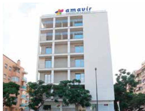
Calle Carles Riba 12-14-16, 43204 - Reus