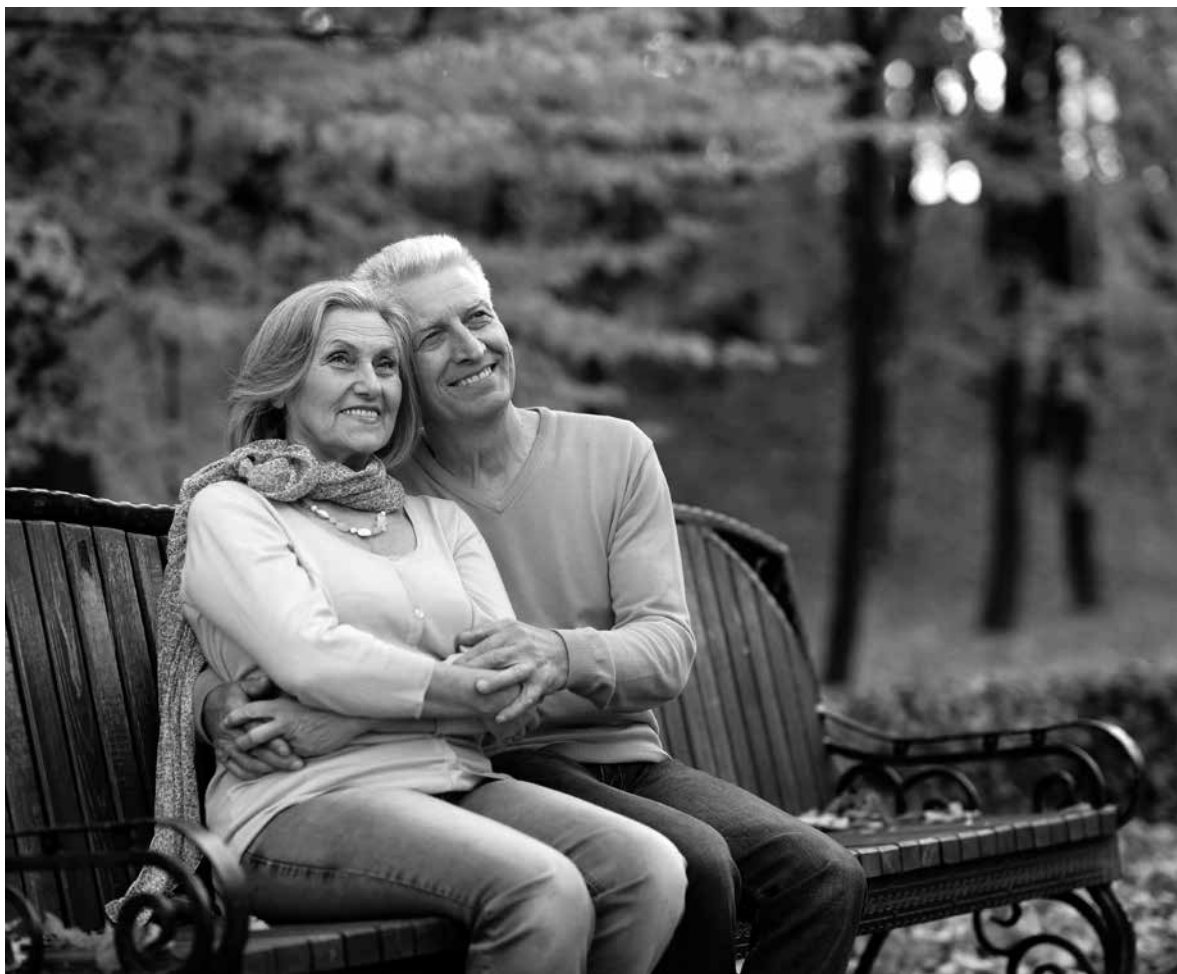
El otoño es una segunda primavera donde cada hoja es una flor.

Con el suave susurro del viento y el crujir de las hojas, el verano se despide para dar paso a una de las estaciones más encantadoras de año, el otoño. Una de las maravillas del otoño es su paleta de colores. Los árboles se visten de tonos cálidos que transforman el paisaje en un cuadro pintado por la naturaleza. Las hojas caídas crean una alfombra crujiente que invita a ser explorada, y cada paso resuena con la melodía del cambio. Con el final del verano, muchos de nosotros regresamos a la rutina. Las vacaciones terminan y es momento de retomar actividades, ya sea en el trabajo, la escuela o en proyectos personales. El otoño también nos trae nuevos sabores. Es la época de las calabazas, las manzanas, las castañas etc. Las recetas de sopas y guisos se convierten en protagonistas de nuestras cocinas. La llegada del otoño y el descenso de las temperaturas puede provocar una bajada de defensas en muchas personas, sobre todo en nuestros mayores. Es importante prestar atención a su bienestar físico y emocional y brindarles toda nuestra atención y cariño para que puedan seguir disfrutando de esta maravillosa estación.