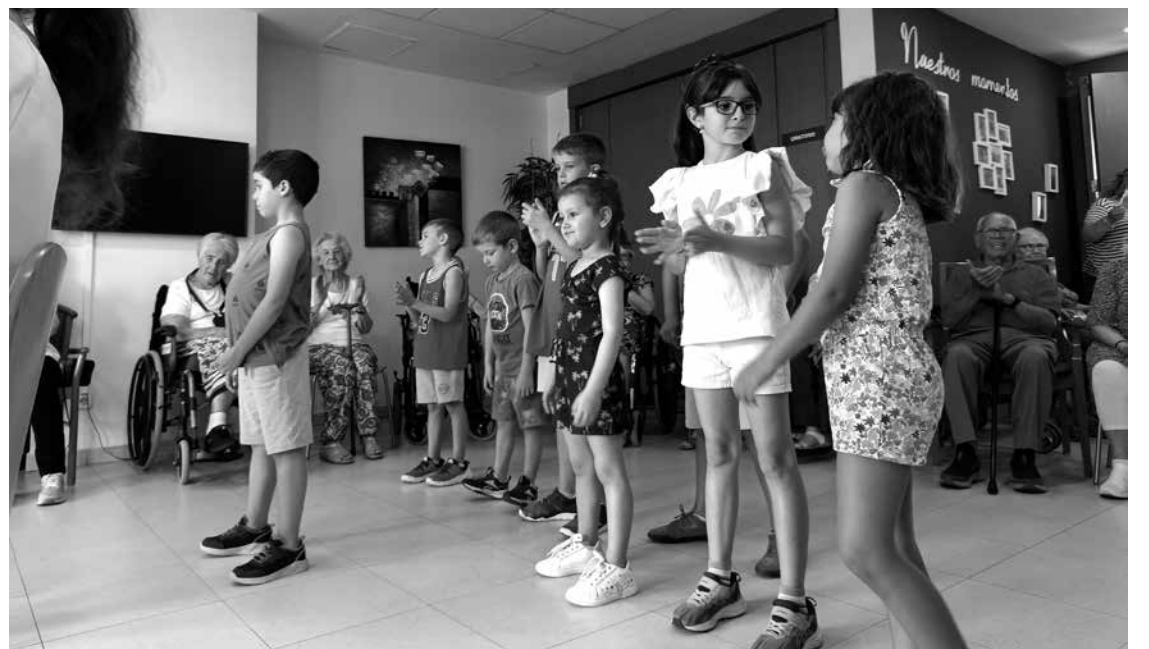
Bailando en el campamento.

Nietos de residentes e hijos de trabajadores han compartido momentos, actividades y emociones con los usuarios de Amavir Getafe. Realizamos juegos donde participaron todos juntos como pinturas, elaboración de bolsas, gorras, pulseras, marcapáginas y hasta bailes, donde ambas generaciones han estado muy dispuestas, sobre todo, a divertirse. También hicimos pruebas de habilidad y conocimiento, así como yincanas, donde contamos con la participación de trabajadores de nuestra oficina central. Creo que se lo pasaron pipa, pero que “se mojaron” demasiado, ya que los niños les despidieron con algún que otro globo de agua. Los peques pudieron disfrutar de nuestra piscina, donde se refrescaron a última hora para reponer fuerzas entre tanta actividad. También, disfrutamos de nuestra versión de Masterchef, cine, un