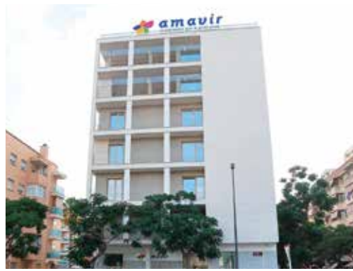
Calle Carles Riba 12-14-16, 43204 - Reus