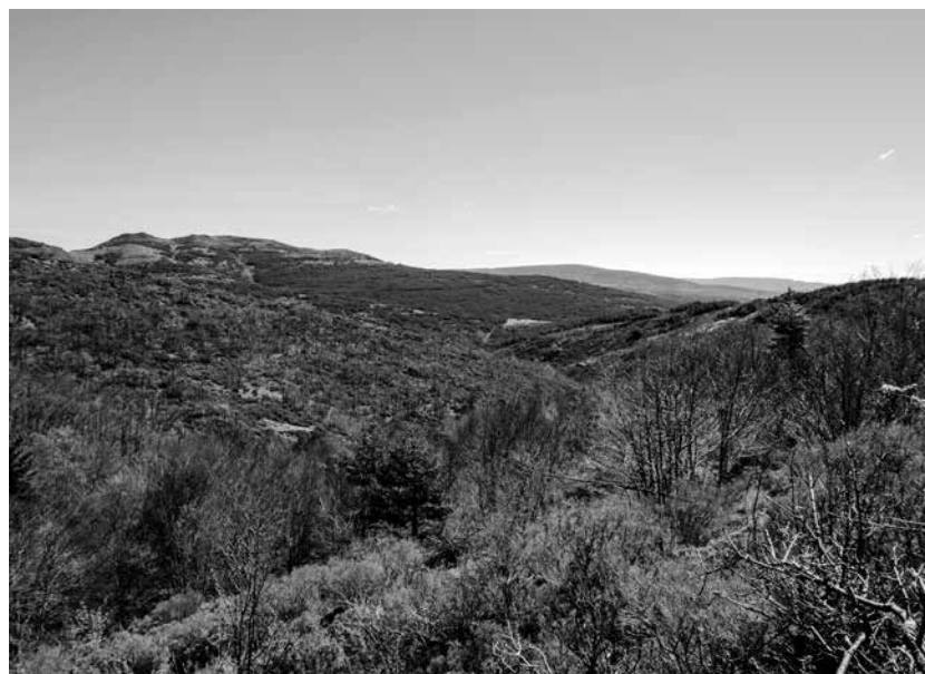
Yacimiento arqueológico celta de Peña Bicuda en Friol.