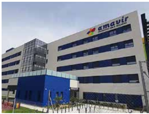
Ctra. de Vicálvaro a Estación de O'Donnell 29, 28032 - Vicálvaro (Madrid)

Además de ampliar la oferta de plazas para atender a las personas mayores y dependientes de estos municipios, la apertura de estos centros servirá también para generar más de 300 puestos de trabajo.