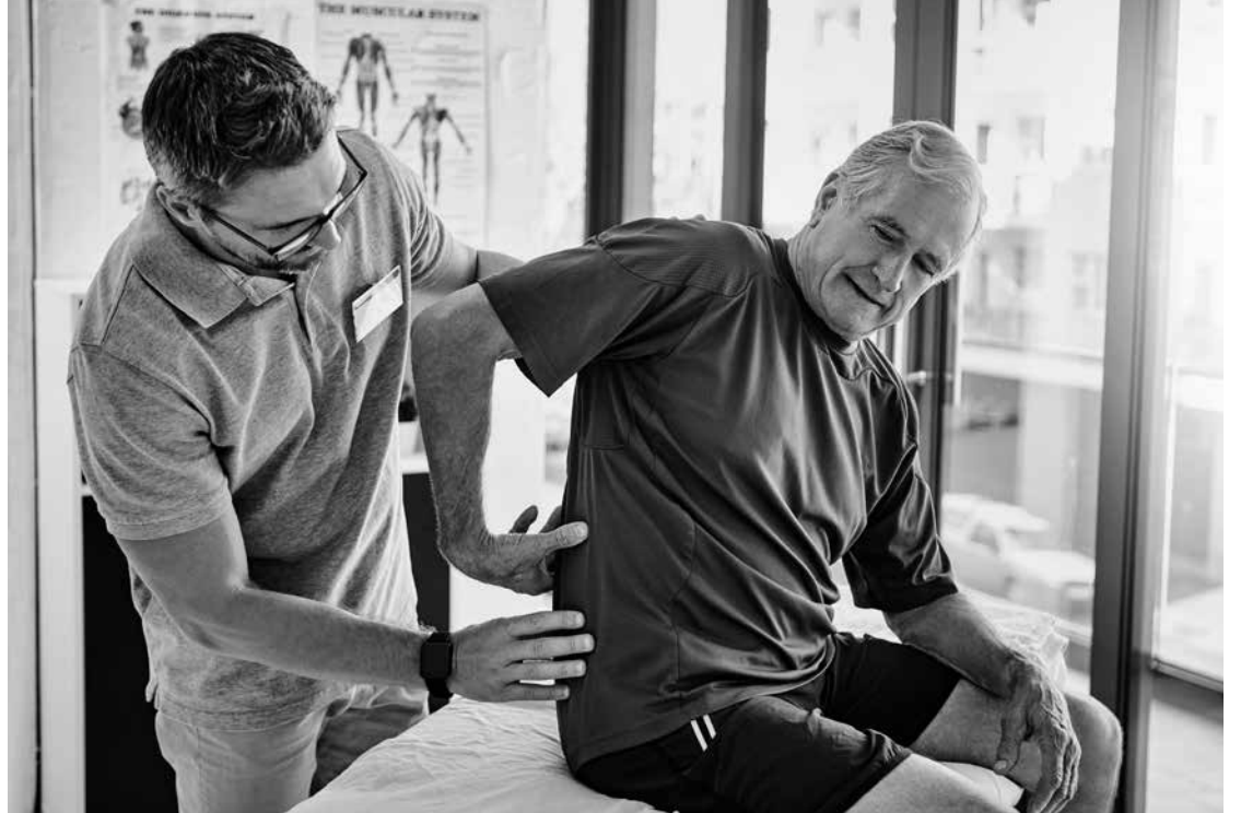
Fisioterapeuta ayudando a un paciente.

A medida que envejecemos, nuestro cuerpo y mente experimentan cambios significativos que pueden afectar a la movilidad, la fuerza, el equilibrio y la capacidad para realizar actividades cotidianas. En nuestro taller buscamos mitigar estos efectos, promoviendo la independencia y el bienestar general de nuestros residentes. Una de las principales razones por las que la rehabilitación funcional es crucial, es para la prevención de las caídas. Mediante ciertos programas que incluyen ejercicios de fortalecimiento muscular, equilibrio y coordinación, se pueden reducir considerablemente el riesgo de caídas y sus consecuencias. A través de actividades físicas adaptadas, no solo ayudamos a mantener la movilidad y la fuerza, sino que también mejoramos la salud cardiovascular y respiratoria, contribuyendo a una mejor vitalidad y ener-