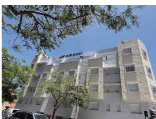
Calle Particular de Padrón 11, 38003 - Santa Cruz de Tenerife