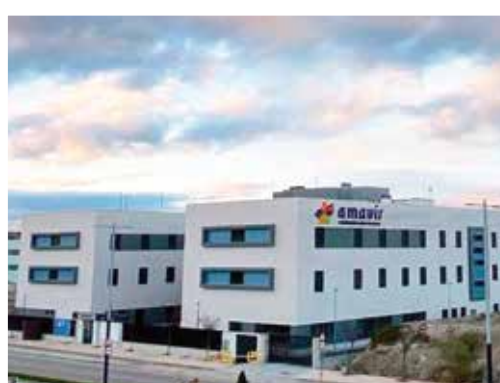
Ronda de Marroquíes bajos 16, 23009 - Jaén