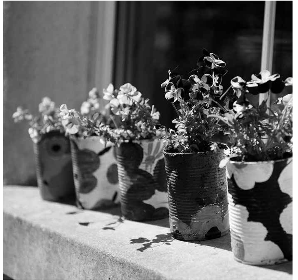
Un ejemplo de macetero que nos sirvió como inspiración.

El reciclaje forma parte de nuestro día a día, sobre todo a la hora de realizar manualidades. Como estamos poniendo en marcha el jardín, pensamos en comenzar a fabricar nuestros propios maceteros. Buscaremos diferentes modelos para que eligieran el que más les gustase. Como ejemplo podemos ver el macetero que aparece en la foto. Solo necesitamos botes de conserva o de otros productos, pinturas y mucha imaginación para decorarlos. Otro ejemplo sería utilizando botellas de refrescos y darles la forma que más nos guste. Podríamos darle, por ejemplo, la forma de un gato para después pintarlo de esa manera original. Con este tipo de actividades, además de concienciar a la hora de reciclar, también trabajamos con nuestros residentes diferentes aspectos funcionales y cognitivos, que les ayuda a estar activos, participativos y aumentar su colaboración en el cuidado de la residencia.