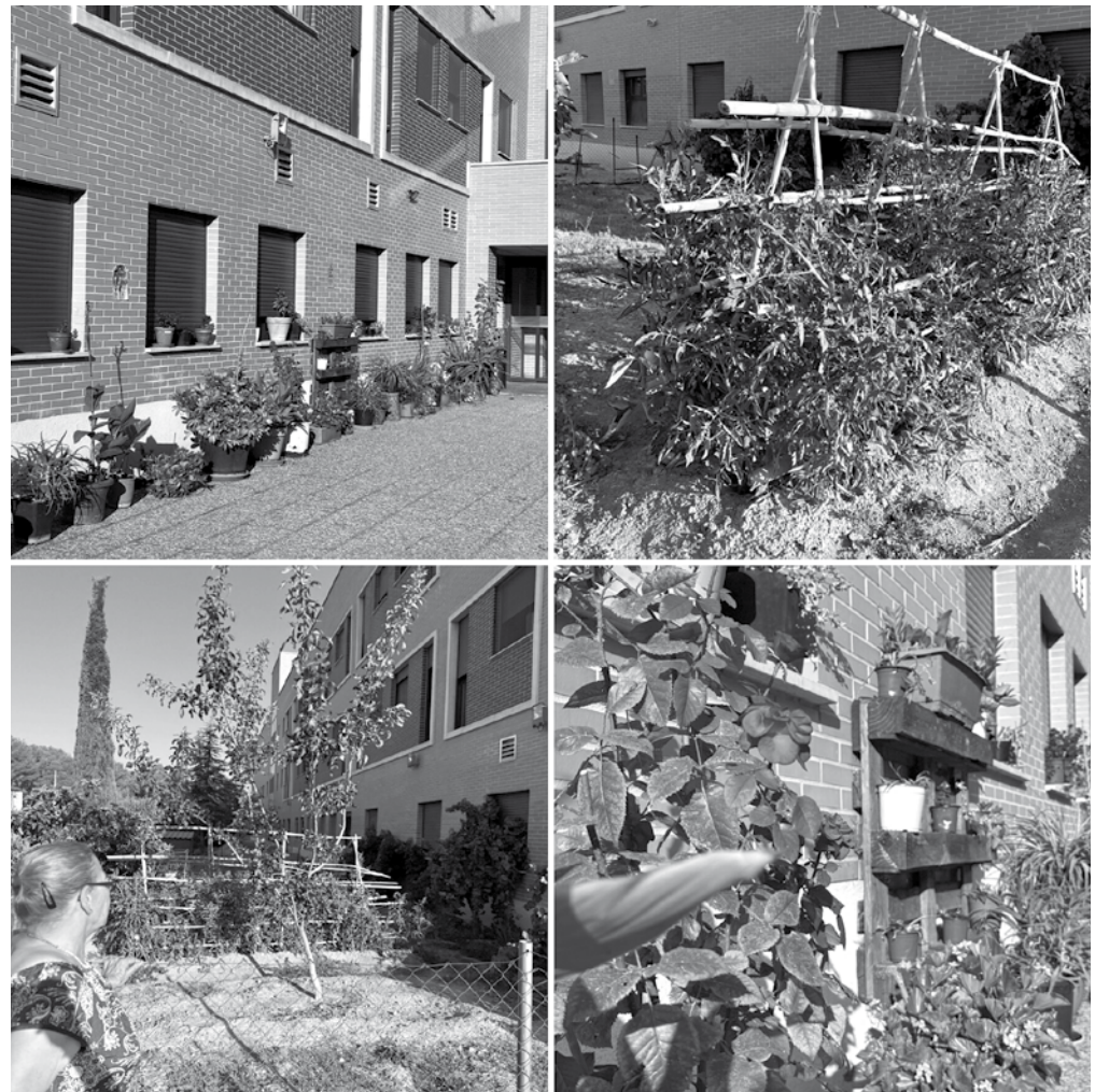
Imágenes del huerto y del jardín en conjunto.

El huerto de Las Hazas vuelve a estar en funcionamiento. Hace unos años en la residencia empezamos a cultivar un trocito de tierra y en ella se plantaban tomates, habas y coliflor entre otros vegetales. Con el tiempo, el uso del huerto fue decayendo, pero actualmente un grupo de residentes ha decidido darle vida de nuevo. Esta vez al cuidado del huerto tenemos que añadirle el cuidado de las plantas de nuestro jardín. En él tenemos habilitada una zona de relajación con varios tipos de plantas que un grupo de residentes se encarga de cuidar. Entre ellos se reparten las tareas para que sigan creciendo sanas y bonitas. En las salidas que realizamos al mercadillo local también aprovechan para comprar plantas nuevas y, con la ayuda del responsable de jardinería, consiguen todo lo necesario para su cuidado. La inauguración del huerto ha comenzado con una pequeña plantación de tomates, pero no se descarta que en breve tengamos nuevos cultivos. Este tipo de programas son muy importantes para nuestros residentes ya que son actividades significativas que les ayuda a sentirse útiles e integrados en los trabajos que se realizan en la residencia.