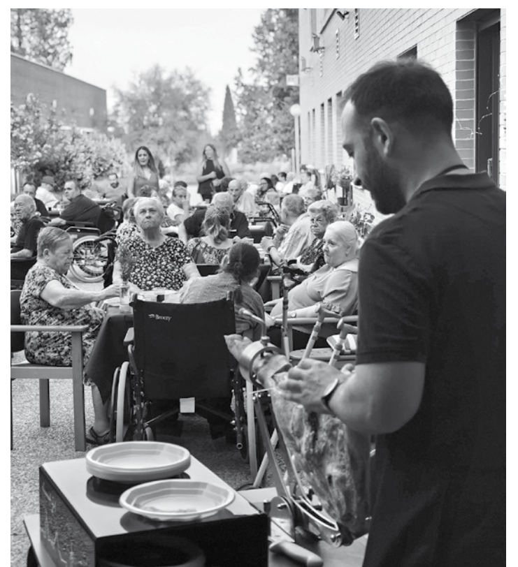
Uno de los momentos de la cena.