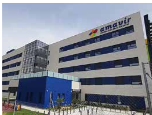
Ctra. de Vicálvaro a Estación de O'Donnell 29, 28032 - Vicálvaro (Madrid)

Además de ampliar la oferta de plazas para atender a las personas mayores y dependientes de estos municipios, la apertura de estos centros servirá también para generar más de 300 puestos de trabajo.