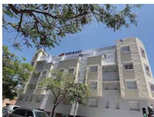
Calle Particular de Padrón 11, 38003 - Santa Cruz de Tenerife