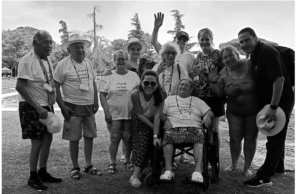
Recordando la primera salida a la piscina en julio.

Como es tradición en nuestro centro, este año realizamos la salida a la piscina en los meses de julio y agosto. Comenzamos la jornada con la puesta a punto; bañador, toalla y crema solar, ya que las olas de calor atizaban en estos meses. Por la mañana nos metimos al agua, realizamos una sesión de gimnasia en medio acuático, ya que, el agua nos proporciona un medio que facilita el movimiento, mientras que en tierra nos cuesta mucho más caminar, hacer apoyo con los pies o elevar las rodillas. Estas salidas nos permitieron por una parte romper la rutina realizando actividades que no solemos hacer durante el año. Pudimos ver a los mayores nadar, flotar, perder el miedo al agua y pasar un rato charlando y divirtiéndose en la orilla. Esta actividad ha motivado a nuestros residentes a hacer cosas diferentes y mejorar la interacción entre los usuarios, permitiéndoles charlar con personas de otras generaciones, como es el caso de los niños de los campamentos. De este modo, mantienen tanto sus capacidades cognitivas como funcio-