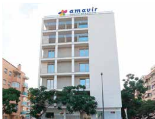
Calle Carles Riba 12-14-16, 43204 - Reus