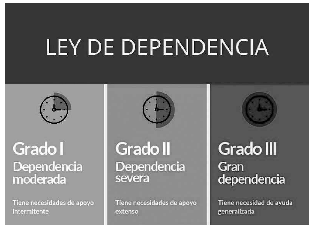
Los grados de dependencia establecidos.

Es decir, aplicada a personas que por razones de edad, enfermedad o discapacidad, necesitan apoyo para las actividades básicas de la vida diaria. El primer paso para acceder al catálogo de servicios y/o prestaciones económicas que ofrece la ley es presentar una solicitud en los servicios sociales del ayuntamiento en el que esté empadronada la persona interesada, ya sea de forma telemática o presencial. Después, la Dirección General de Atención al Mayor y la Dependencia se pondrá en contacto con el interesado para fijar el día y hora de la valoración. Mediante entrevistas y el análisis de los informes médicos, se realiza la valoración que clasifica la dependencia en moderada (Grado I), severa (Grado II) y gran dependencia (Grado III). Tras la valoración, se emite una resolución que reconoce el grado de dependencia del solicitante. Con base en esta resolución, se elabora un Plan Individual de Atención (PIA), que determina los servicios y prestaciones adecuados para el dependiente y puede incluir ayudas económicas, centros de día o residencias. Si