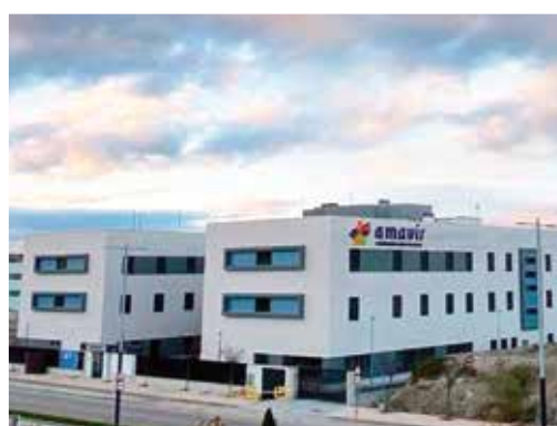
Ronda de Marroquíes bajos 16, 23009 - Jaén