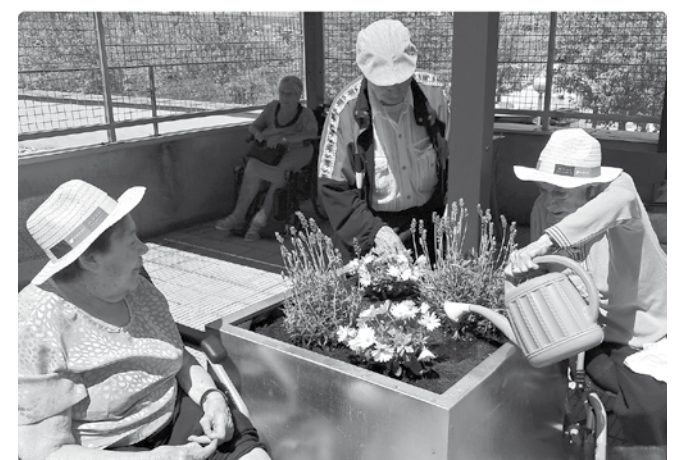
I així de bonic ho vam deixar!