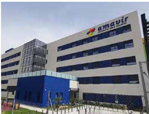
Ctra. de Vicálvaro a Estación de O'Donnell 29, 28032 - Vicálvaro (Madrid)

Además de ampliar la oferta de plazas para atender a las personas mayores y dependientes de estos municipios, la apertura de estos centros servirá también para generar más de 300 puestos de trabajo.