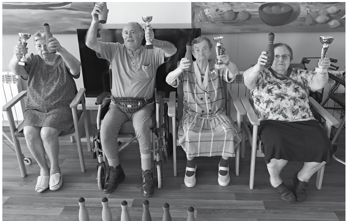
Els guanyadors de la temporada 2023-2024!